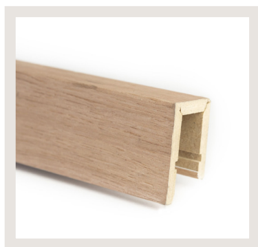
APERCU DU PRODUIT